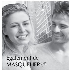
Également de MASQUELIER'S®

Bien que l'on ne connaisse aucune conséquence négative suite à l'utilisation des principes actifs d'Anthogenol®, il est généralement plus sage et par précaution de ne pas prendre Anthogenol® lors de grossesse et d'allaitement sans avoir consulté votre médecin ou thérapeute.