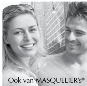
Ook van MASQUELIER'S®

Alhoewel er geen nadelige gevolgen bekend zijn van het gebruik van de actieve ingrediënten in Anthogenol®, is het in het algemeen verstandig om bij zwangerschap of borstvoeding uit voorzorg Anthogenol® niet te gebruiken zonder uw arts of therapeut te hebben geraadpleegd.